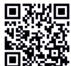
Imagefilm zur Ausstellung