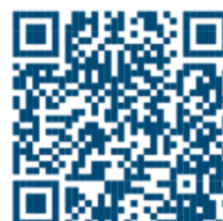
Digitaler Flyer zur Ausstellung