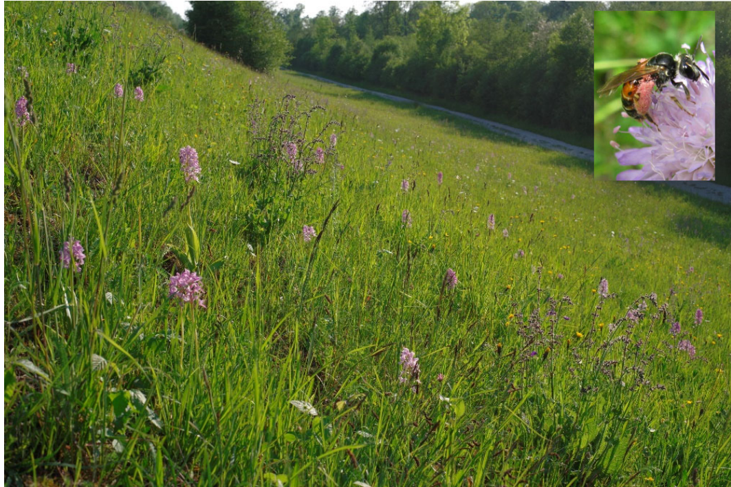
Abbildung 6 Orchideen auf den Wiesen am Damm

finden. Für wärmeliebende Insektenarten, insb. Tagfalter, Heuschrecken und Wildbienen stellen die artenreichen Offenlandlebensräume der Dämme herausragende Habitate und Vernetzungsstrukturen dar.