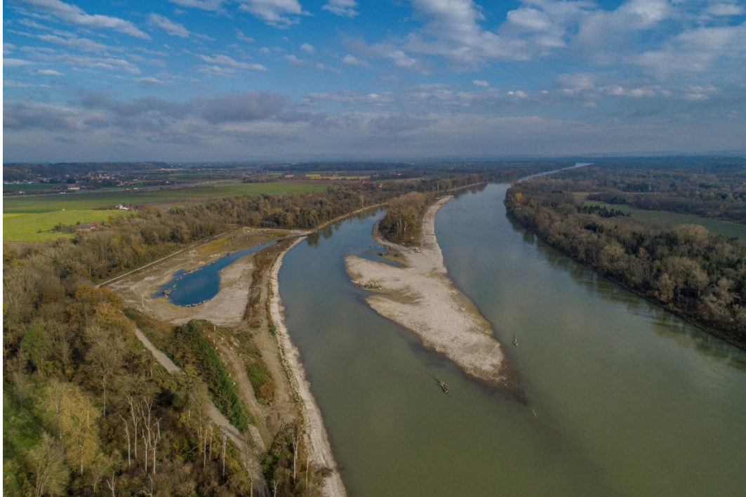
Abbildung 4 Übersichtsfoto des Insel-Nebenarmsystem 2019 nach Fertigstellung