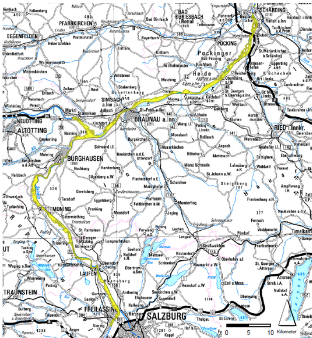
Abbildung 1 Lage des gesamten FFH-Gebiets „Salzach und Unterer Inn“

Folgende Abbildung zeigt die Lage des gesamten FFH-Gebietes.