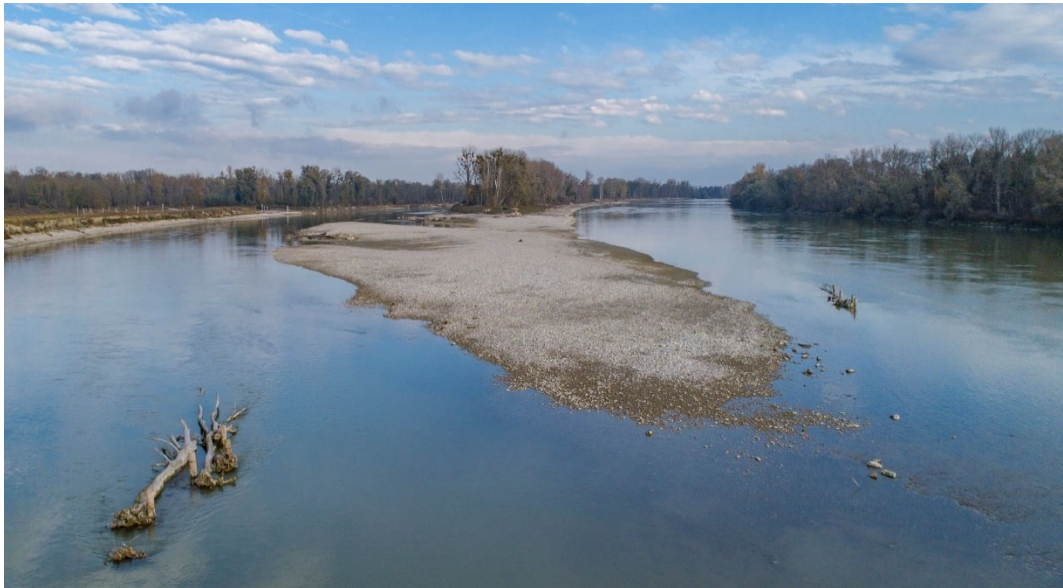
Abbildung 5 Foto Kiesbänke Insel-Nebenarmsystem