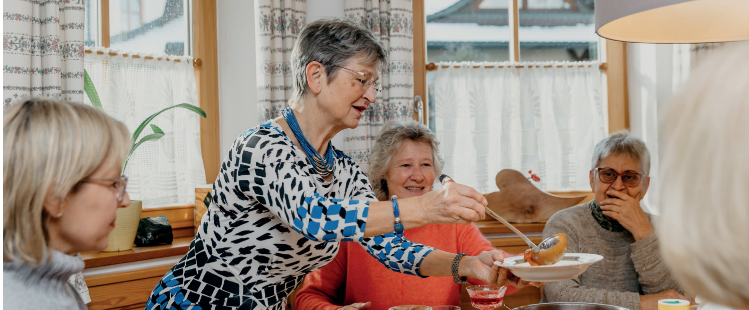
Raimund Kneidinger Landrat