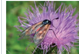
Keilfleckwidderrchen auf Distel

Wo Blütenreichtum herrscht, finden nicht nur Honig- und Wildbienen Nahrungsquellen, sondern auch viele andere Insekten wie Schmetterlinge, Schwebfliegen oder Käfer. Und nicht