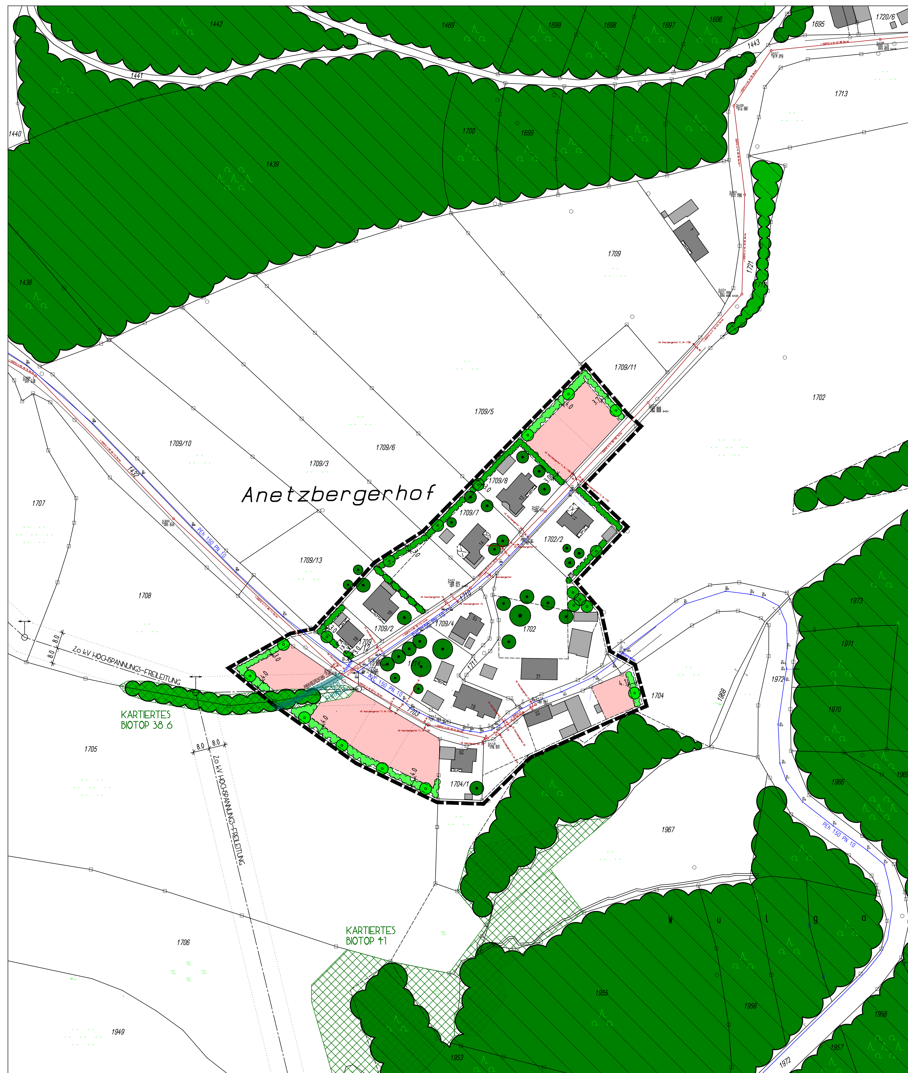
L A G E P L A N M 1 : 1 0 0 0