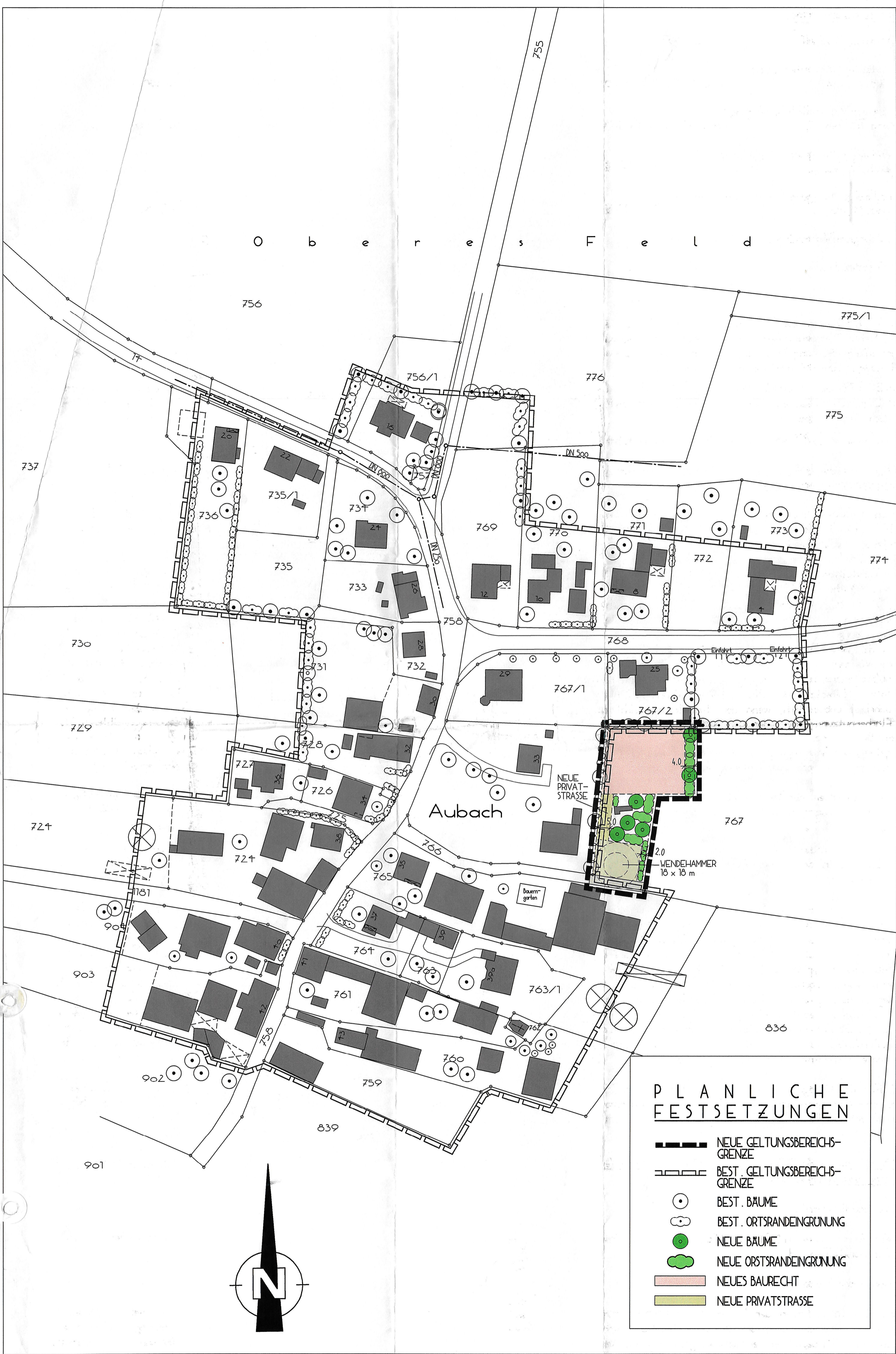
L A G E P L A N M 1 : 1 0 0 0