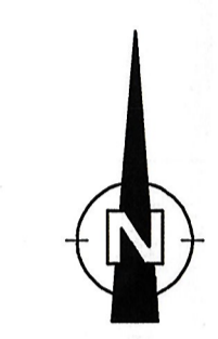
L A G E P L A N M 1 : 5 0 0 0