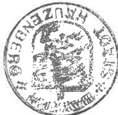
..... Gudrun Donaubaauer 1. Bürgermeisterin