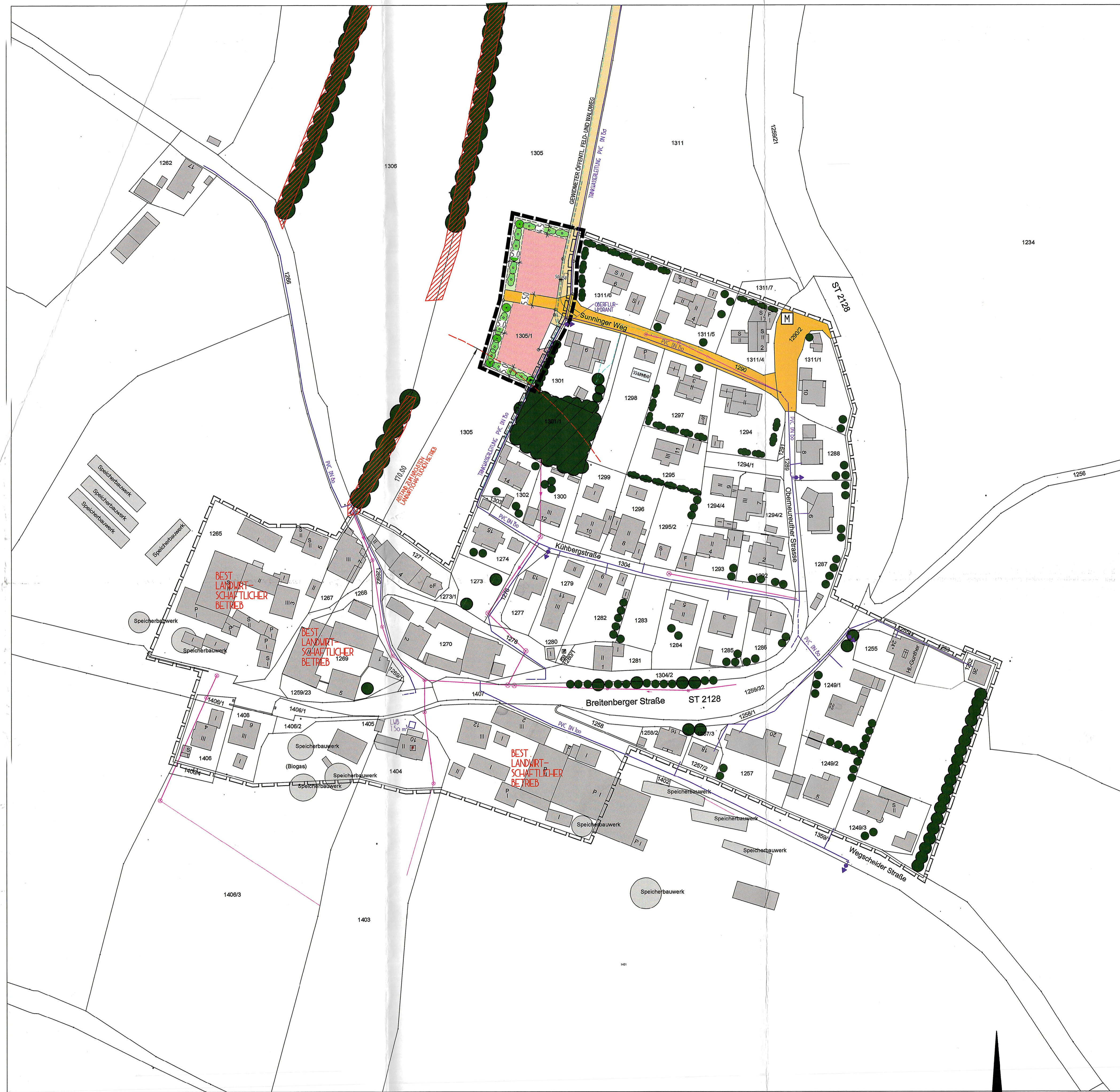
L A G E P L A N M 1 : 1 0 0 0