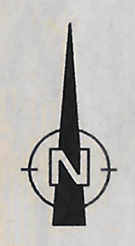
L A G E P L A N M 1 : 5 0 0 0