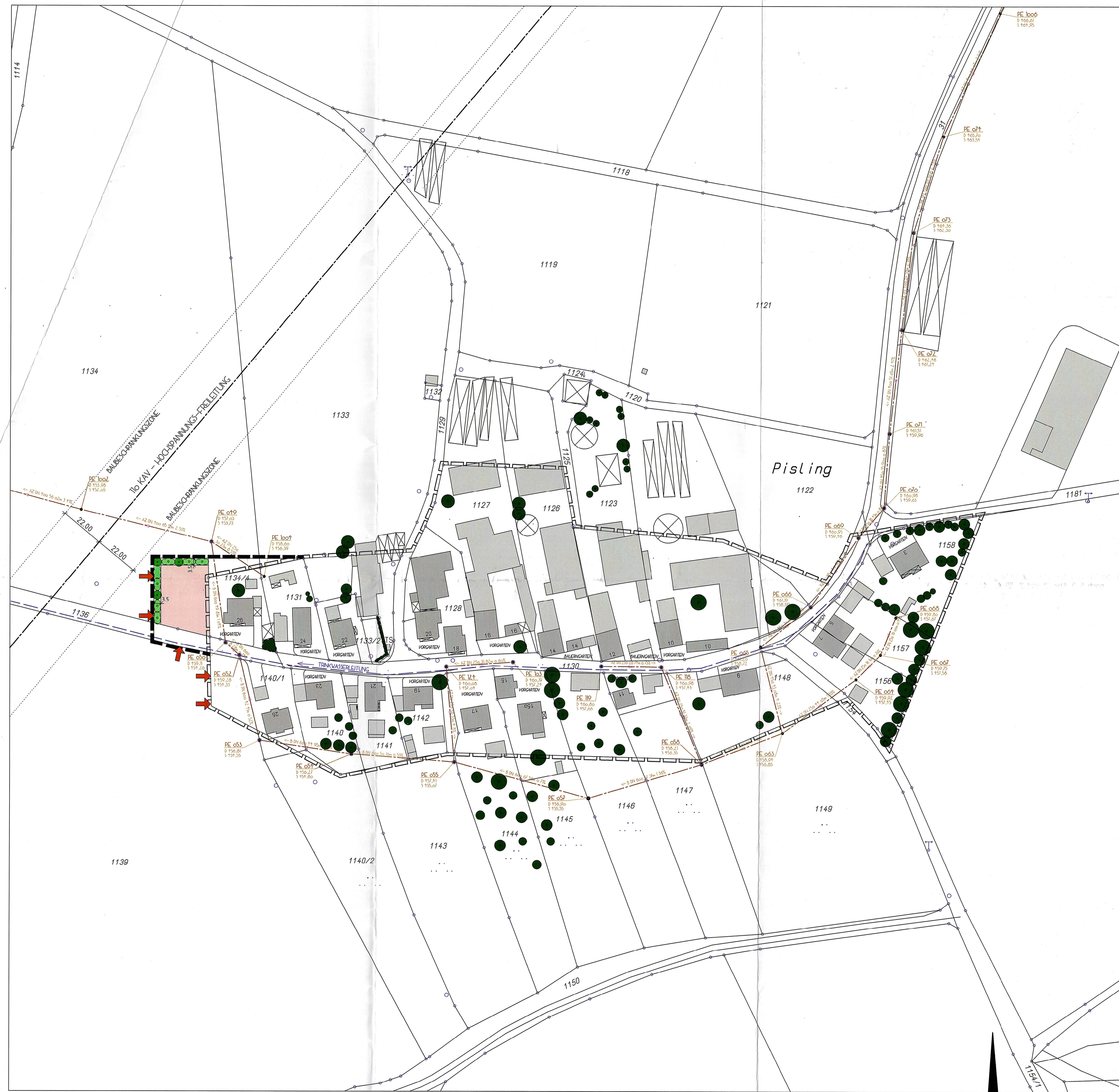
L A G E P L A N M 1 : 1 0 0 0