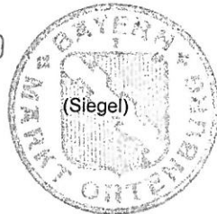
R. Hoenicka 1. Bürgermeister