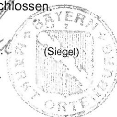
R. Hoenicka 1. Bürgermeister