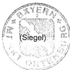
R. Hoenicka 1. Bürgermeister