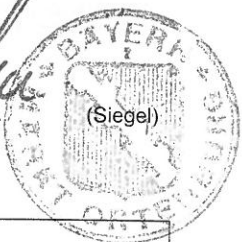
R. Hoenicka 1. Bürgermeister