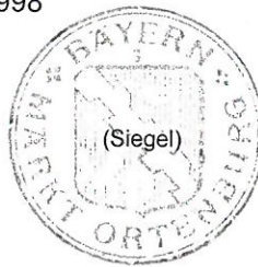
R. Hoenicka 1. Bürgermeister