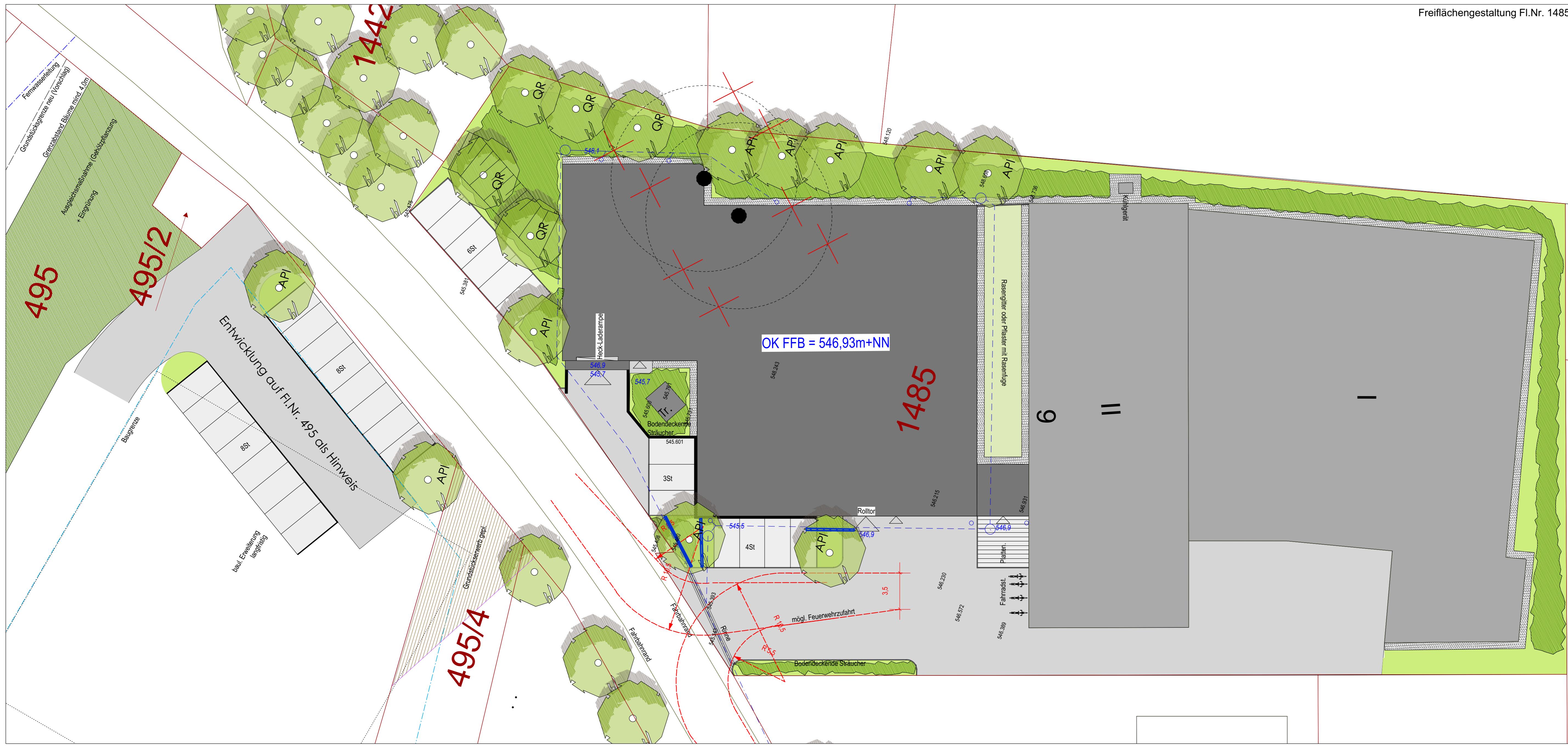
Freiflächengestaltung Fl.Nr. 1485

z.B. 546,256 Höhenkote bestehendes Gelände 546,5 Höhenkote OK Bauteil / Gelände gepl.