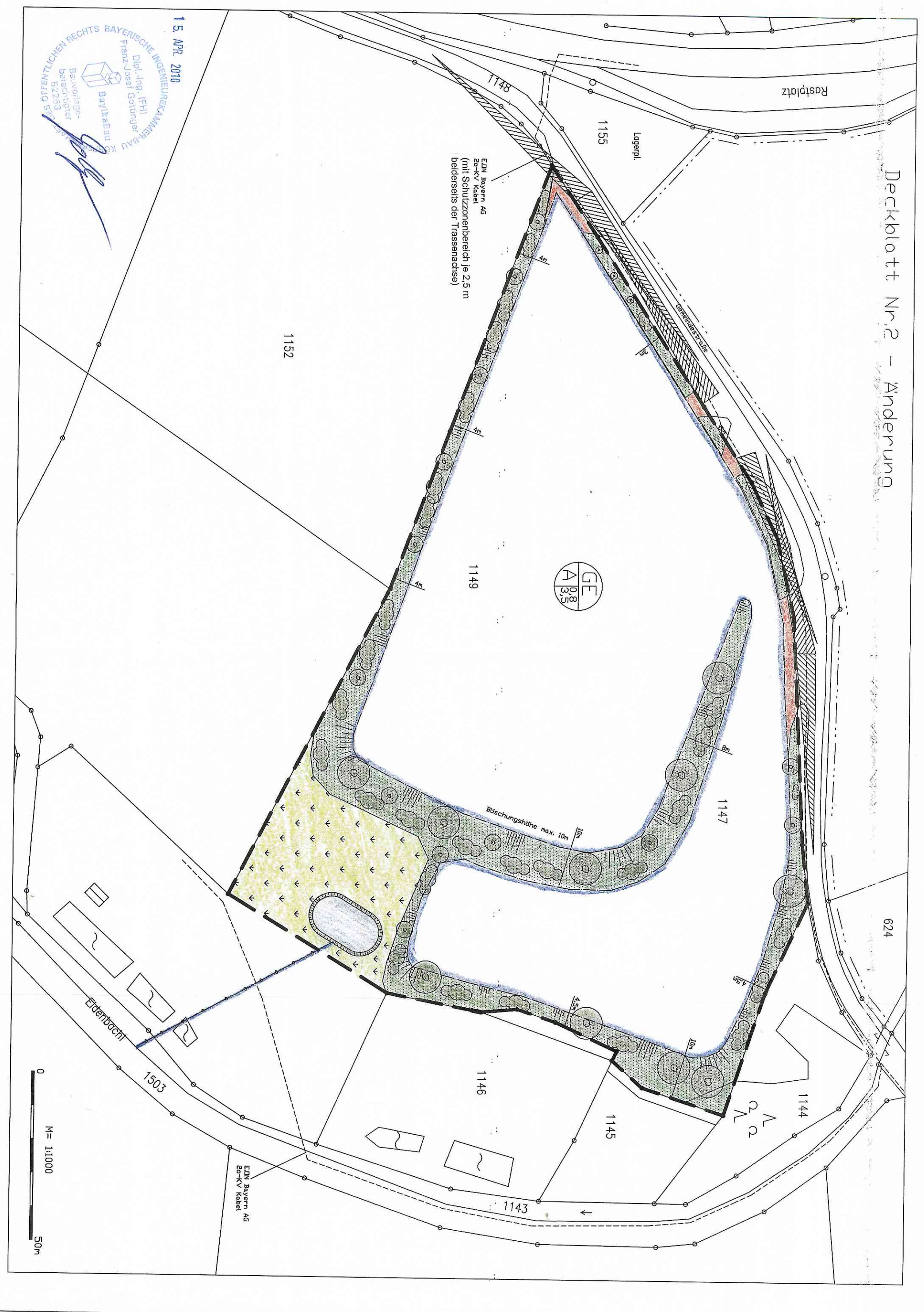
Deckblatt Nr. 2 - Änderung