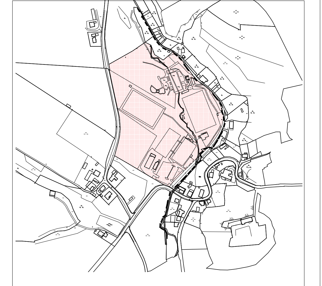
ÜBERSICHTSPLAN M 1:5000