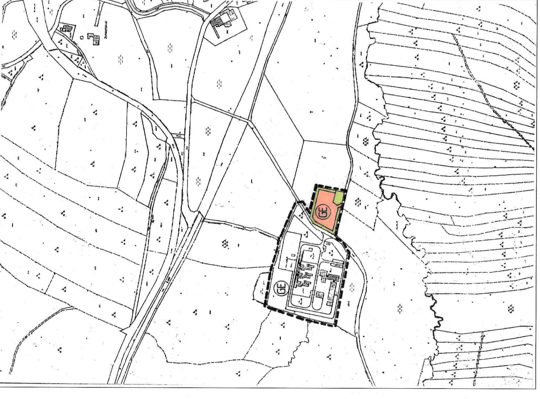
LAGEPLAN M 1 : 5000